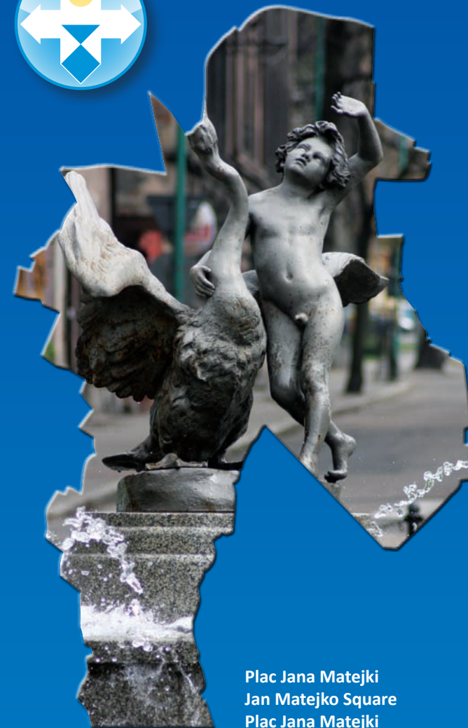
Plac Jana Matejki Jan Matejko Square Plac Jana Matejki